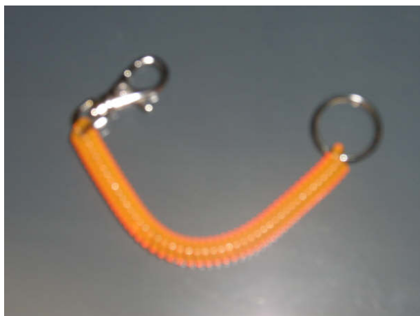
Imagen del llavero elástico.